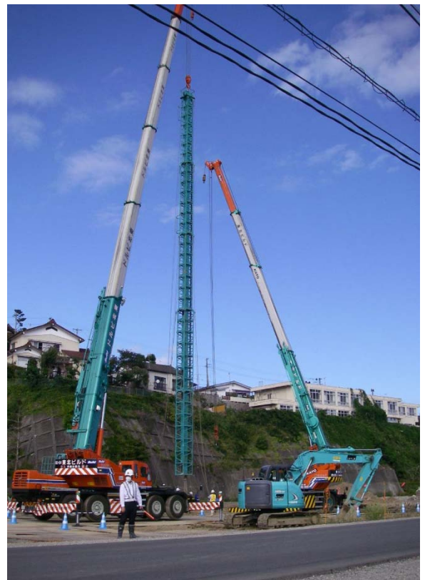
試験盛土のための地盤改良工(ドレーン打設)