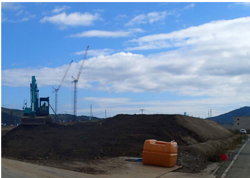
盛土材の一時仮置き状況