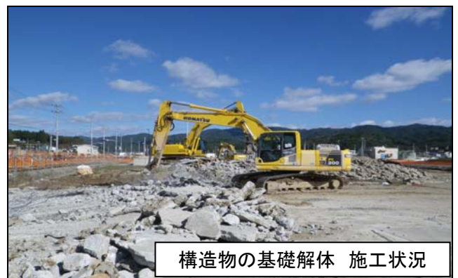
構造物の基礎解体 施工状況